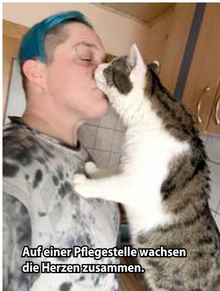
Auf einer Pflegestelle wachsen die Herzen zusammen.