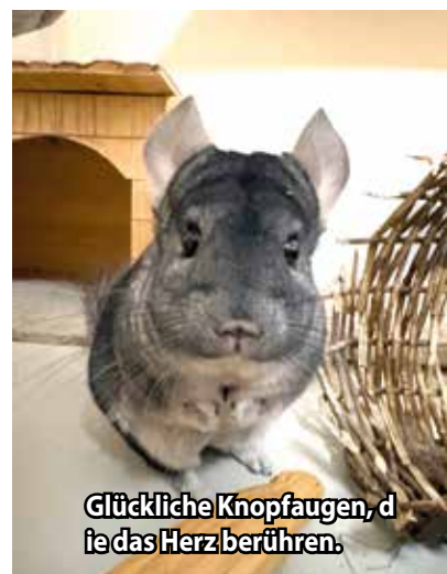
Glückliche Knopfaugen, die das Herz berühren.

Chipsy und Neo hatten Glück. Vor kurzem hat sich eine junge Frau im Tierheim gemeldet, die sich über alle Erfordernisse informiert und diese umgesetzt hat. Die beiden liebenswerten Fellknäuel durften in ein neues Zuhause ausziehen und wurden schnell handzahn.