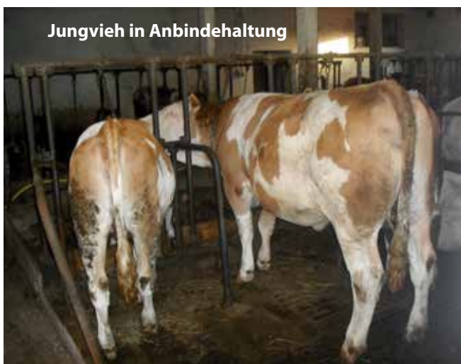
Jungvieh in Anbindehaltung