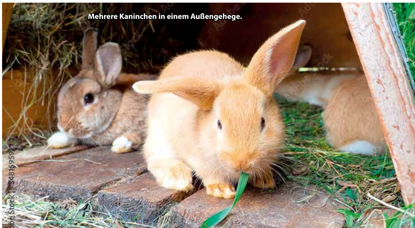
Mehrere Kaninchen in einem Außengehege.