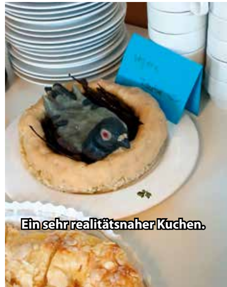
Ein sehr realitätsnaher Kuchen.

Ein sehr gelungenes Fest hatten die Ehrenamtlichen des Vereins Stadttauben Saarbrücken e.V. anlässlich ihres 20 jährigen Jubiläums im Pfarrheim St. Jakob in Saarbrücken ausgerichtet und viele Gäste waren gekommen.