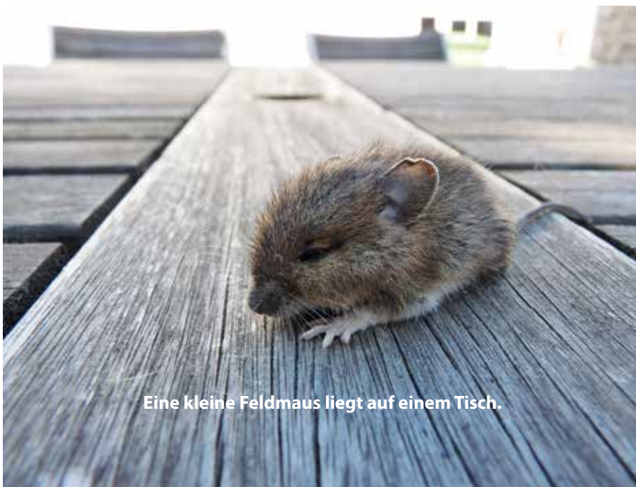
Eine kleine Feldmaus liegt auf einem Tisch.