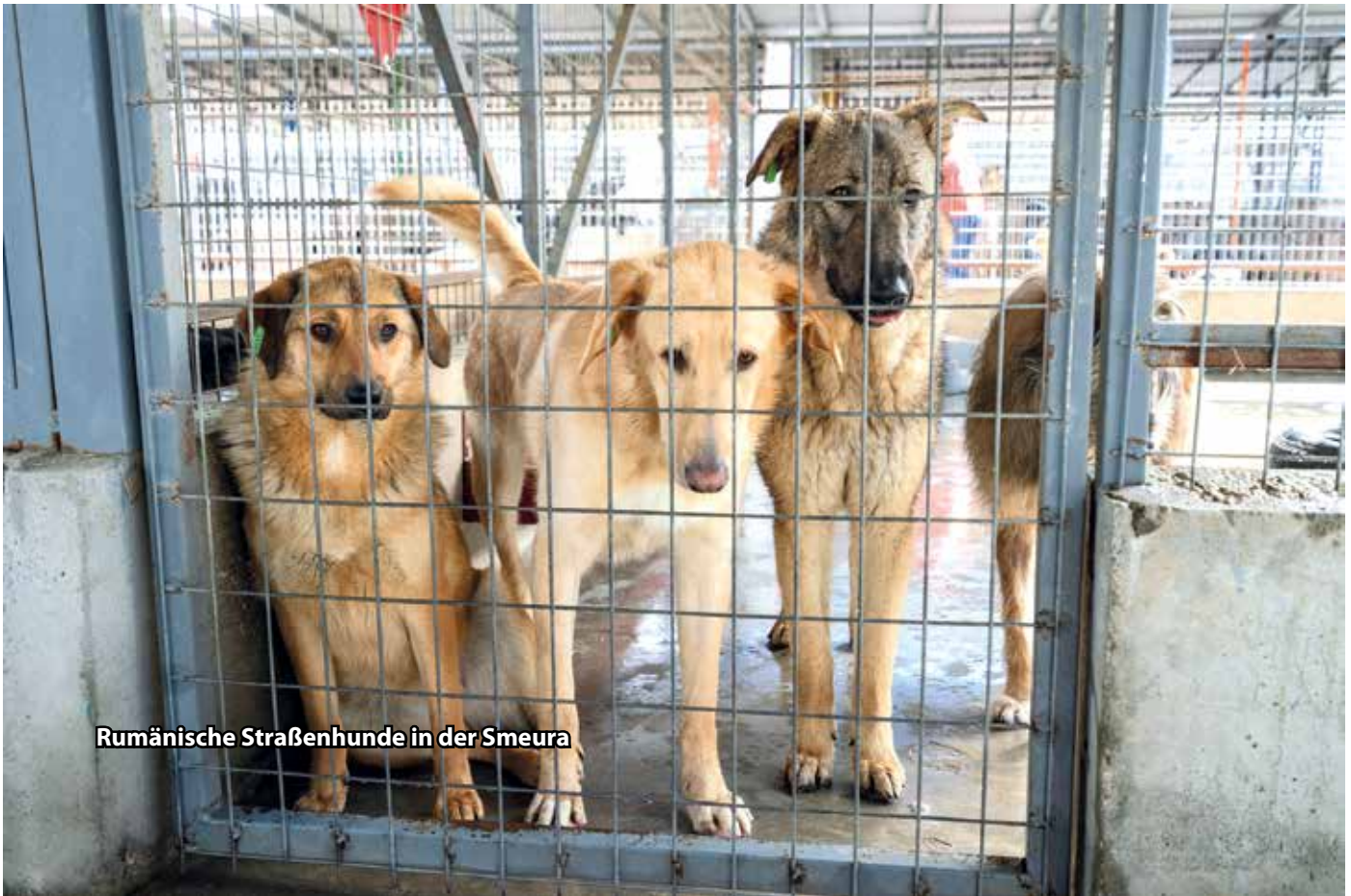
Rumänische Straßenhunde in der Smeura