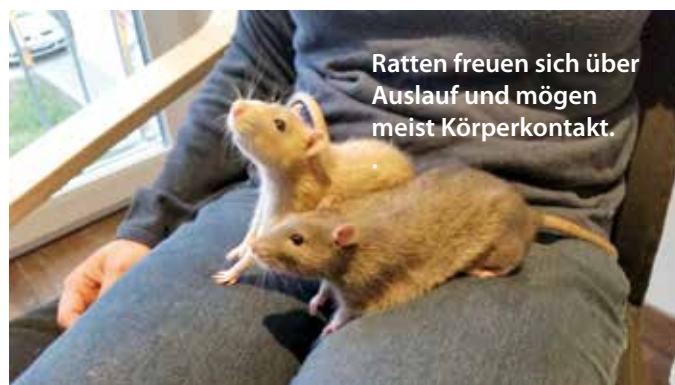
Ratten freuen sich über Auslauf und mögen meist Körperkontakt.