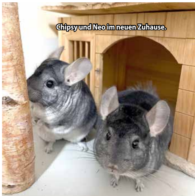
Chipsy und Neo im neuen Zuhause.

Chinchillas zählen wohl zu den ausgefallensten Nagetieren, die als Haustiere gehalten werden. Sie stellen besondere Anforderungen an ihre Haltung und brauchen einen großen Lebensraum.